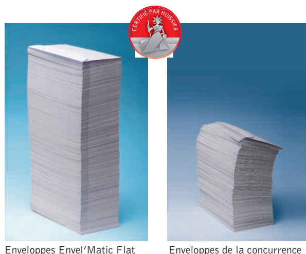
Enveloppes Envel'Matic Flat

Plus de 70 tests ont été effectués sur l'ensemble des machines employées dans la profession, notamment de marque Kern, Pitney Bowes et Neopost. Ils ont prouvé la compatibilité des Envel'Matic Flat sur toutes les machines standards et dans toutes les cadences.