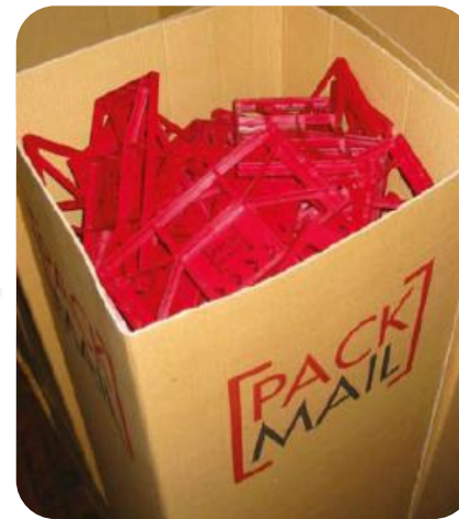
Traitement des plaques et du film par GPV France