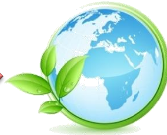
100% valorisés et recyclés par GPV