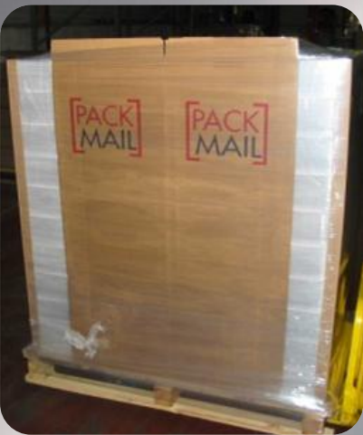
Livraison des bennes cartons avec les produits

[PACK MAIL] Une solution globale jusqu'au recyclage