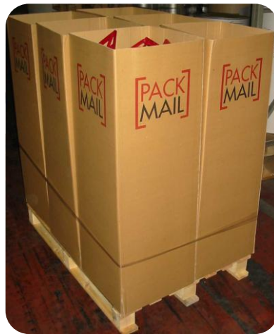
Stockage des déchets: 1 palette = 6 bennes